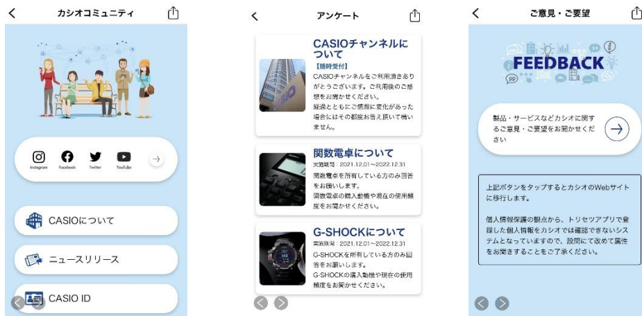
カシオコミュニティ画面